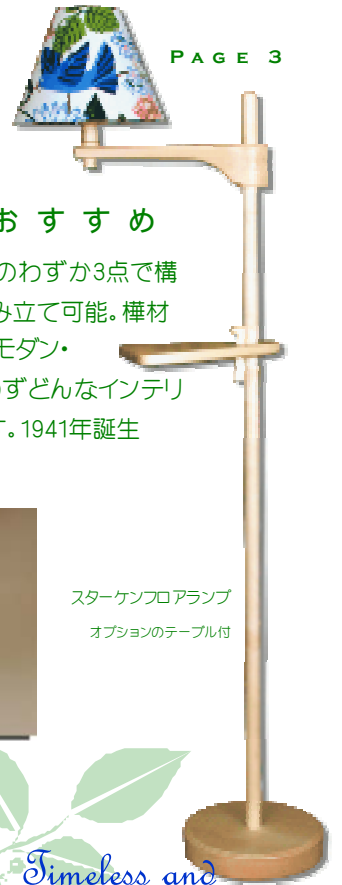
スターケンフロアランプ オプションのテーブル付