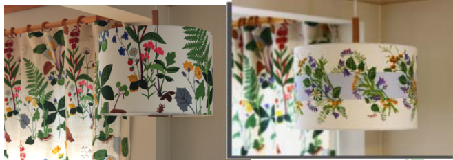
ペンダントランプ(2灯) 左:ロールスリダ 右:メイストン

ム・ポール・ベースのわずか3点で構成され、簡単に組み立て可能。樺材の高級仕上げで、モダン・クラシックを問わずどんなインテリアにもマッチします。1941年誕生