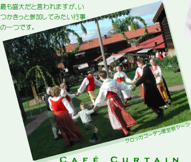
クロッカゴーデン夏至祭シーン

敷いて寝ると、夢の中で未来の花婿(花嫁)に会えるか…。なかでも、ダーラナ地方の夏至祭が最も盛大だと言われますが、いつかきっと参加してみたい行事の一つです。