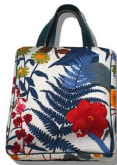
マリリーズDX/バッグ W32H37(57) D6cm

ちょっとおしゃれなお出かけにも、カジュアルなショッピングにも手放せなくなる、トスカーナレザーのワンポイントが個性的なバッグ。