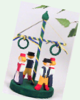
メイポールダンス置物