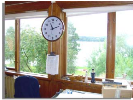
工房からのシリアン湖の一望。緑豊かな周囲にはベリーがいっぱい。

シリアン湖と、美しい花々やナナカマドなどのベリー類がたわわな自然が一望できる工房内のプリントテーブルの傍らで、スタッフ全員と過ごした楽しいフィーカのひと時が忘れられません。豊かなインスピレーションがわき出してくる恵まれた環境だからこそ数々の美しいデザインが創出されたのもうなずけます。