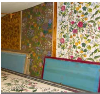
色ごとの版を、寸分の狂いもなく刷り重ねていく、匠の技。