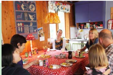
仕事の合間のスタッフと団らんのフィーカのひと時。おいしいコーヒーとスイーツで笑顔がこぼれる。