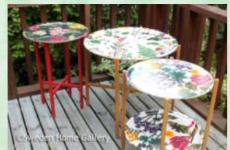
人気のトレイテーブル さまざまなデザインから選べます。