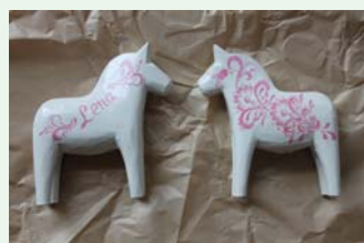
カラー(ホワイトベース)レッド・グリーン・ブルー・グレー・パステルブルー・パステルピンク サイズ:15cm・17cm・20cm