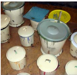
調合された染料。常に一定の狂いのない色出しが求められる。