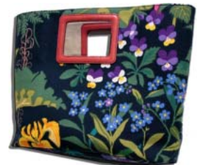
スクウェアバッグ L40xH30xD10cm

右:セカンドバッグとしてもかわいいミニバッグ。W15xH17(30)xD15cm