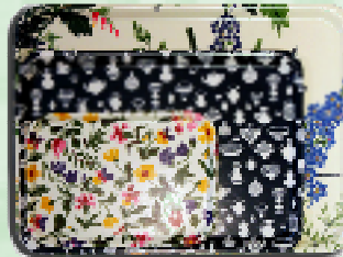
大中小そろったレクタングラートレイ

ミディアムサイズのレクタングラートレイが仲間に加わりました。コーヒートレイでは小さすぎるけれど、ラージサイズでは大きすぎて…。そんな悩みを解消し、ランチマット代わりに、ちょうどいいサイズのトレイ登場です。