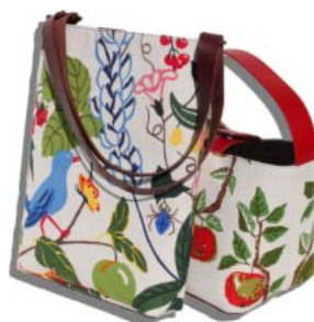
2ウェイバッグ&ミニバッグ

大き目でたっぷりな容量のトートバッグは、ショッピングやお出かけに最適。もちろん、フォーマルなシーンでも。