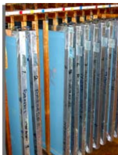
デザイナー一枚に最大で16枚の色ごとの版が使われる。