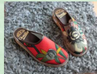
快適な履き心地のヨブスのルームシューズ & 希少種、ゴットランド羊の最高級ファー(毛皮)。赤ちゃんにも優しいつやつやな手触り